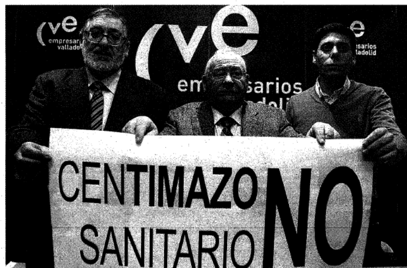
Los representantes de los transportistas, gasolineras y agricultores anunciaron ayer movilizaciones